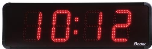
Horloge Heure Minute - Date - Température

04 hauteurs d'affichage : 15, 20, 25 et 45 cm